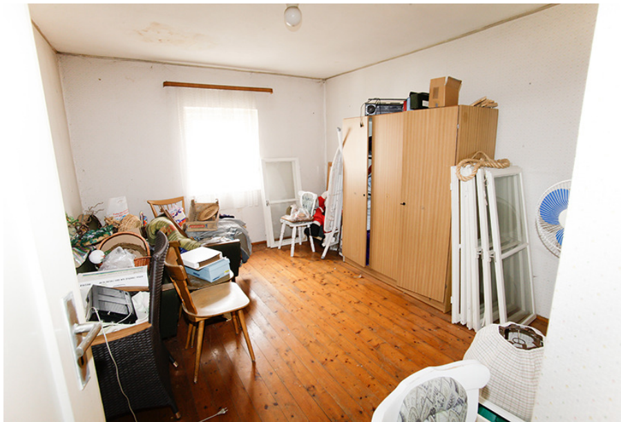
Zimmer 1 DG