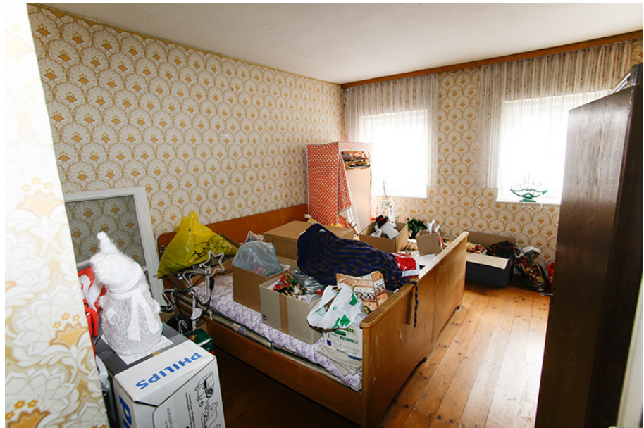
Zimmer 2 DG